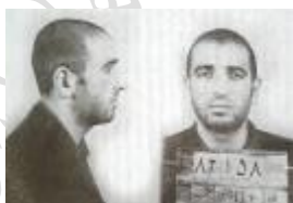
مجاهد خلق علی زرکش در زندان شاه