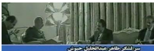
سر لشکر ظاهر عبدالجلیل حیوش

طی چند روزیکه در پاریس بودم در یک پایگاه در نزدیکی شهرک مری سورواز پاریس به همراه محمد علی تشید، مجید معینی (معروف به آقا) و وحید مستقر بودم. هر روز صبح با محمد علی تشید برای دویدن میرفتیم. او تیپ بسیار انرژتیکی بود. در طی اینمدت جهت تحویل گیری کشور زمان در پاریس بود توجیه شدم. محمد علی جابرزاده ملاقات کردم. رفتن به محل ماموریت دیده باشد.